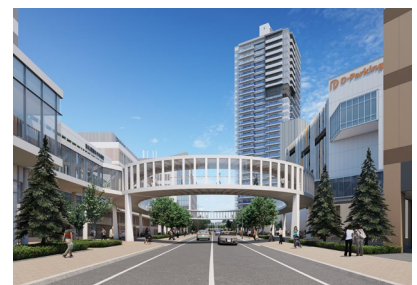
「アクティブリンク」イメージ

あわせて、JR「新札幌駅」・地下鉄「新さっぽろ駅」の両駅と屋内空中歩廊でつなぎ、季節や天気によらず歩行動線を確保しました。屋内空中歩廊の中心で、各施設をつなぐ「アクティブリンク」は、「マーク新さっぽろ」のシンボルとして、医療施設 4 棟の開業に合わせて開通しました。さらに、ホテル前には様々なイベントや催しが開催される広場「アクティブガーデン」を計画中で、2023 年 7 月に完成する予定です。