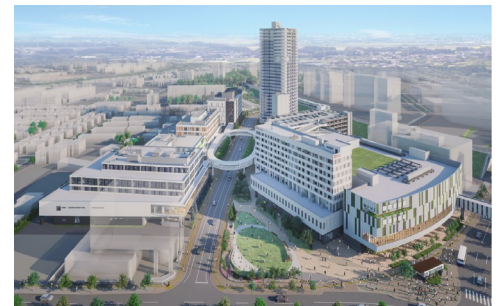
【「マールク新さっぽろ」I街区イメージ】