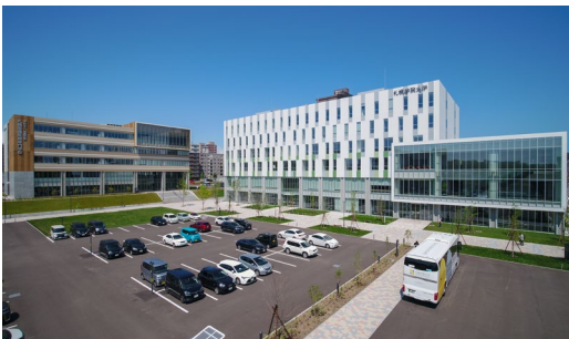
【「マールク新さっぽろ」G街区】

当コンソーシアムは、2023年11月の「マールク新さっぽろ」の完成に向け、「つながる人とまち、多世代が過ごすサステナブルなまちづくり」を目指してまいります。