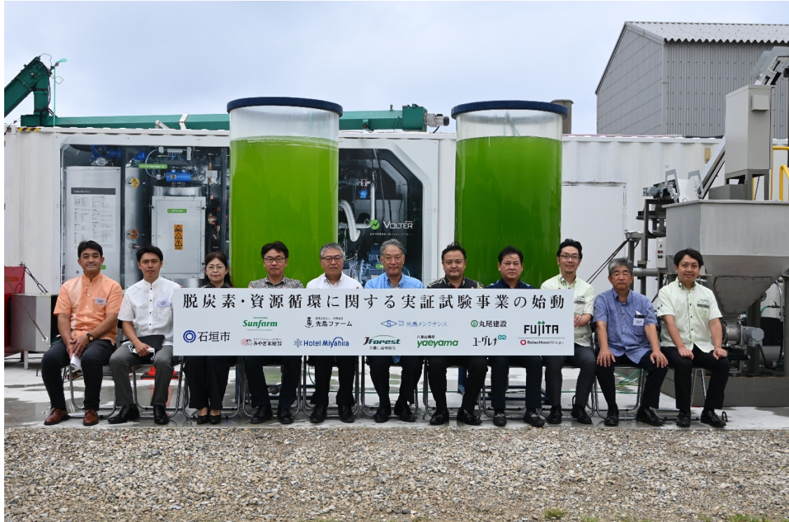
代表者による記念撮影

※5 閉鎖性水域の富栄養化物質である一方で、日本が100%輸入依存する重要鉱物資源かつ肥料源。