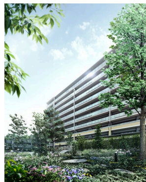
【敷地内緑地のイメージ】