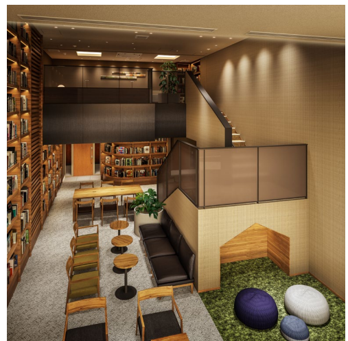
【「ブックライブラリー」のイメージ】