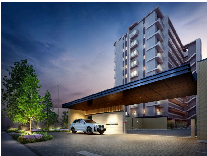
【「プレミスト藤が丘」での車利用イメージ】