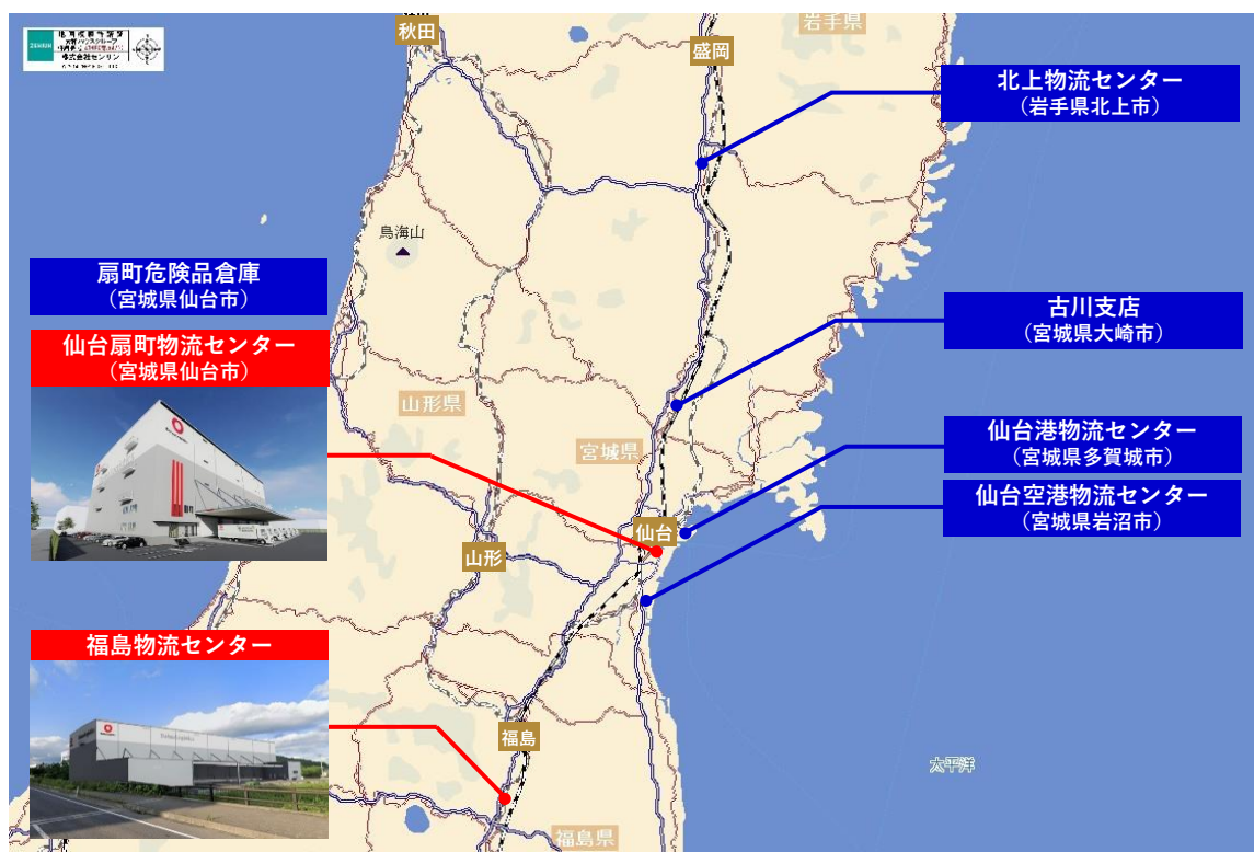
【東北エリアの当社事業拠点】

その中で、当社では全国で物流施設の開発を進めることで、事業基盤の強化に取り組んでいます。東北エリアにおいては、宮城県仙台市に「(仮称) 仙台扇町物流センター」(2022年11月末竣工予定)を開発中で、本センターの建て替えによりエリア内物流ネットワークのさらなる拡充を図ります。