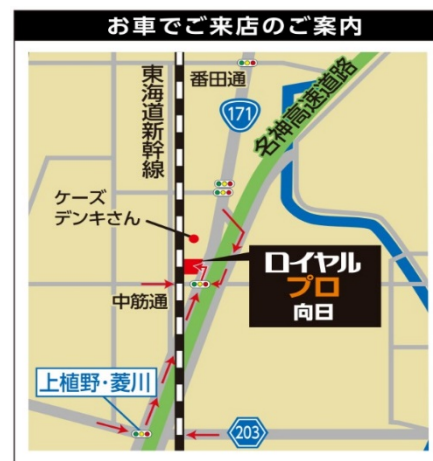
「ロイヤルプロ向日」(案内図)