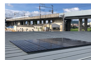
「太陽光発電システム」

※3. 固定価格買取制度（FIT）対象の再エネ電力の再エネ価値を証書化した非化石証書の中でも、再エネ価値の由来となる再エネ電源が特定されているもの。