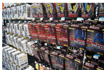
ハーネスなどの「安全用品」