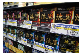
当社オリジナルブランド「漆黒」