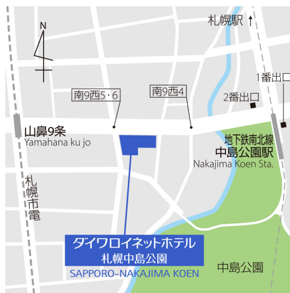
【 「ダイワロイネットホテル札幌中島公園」 地図 】