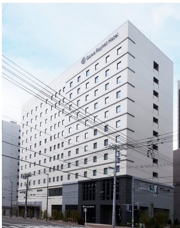
【 外観 】

立地面では、札幌市営地下鉄南北線「中島公園駅」より徒歩4分、新千歳空港からはJR北海道「快速エアポート」等を利用し、約1時間の場所に位置しています。また、徒歩圏内には「日本の都市公園100選」に認定されている「中島公園」や北海道最大の繁華街「すすきの」があるなど、ビジネスはもちろん、家族や友人同士など、幅広いお客さまにご利用いただけます。