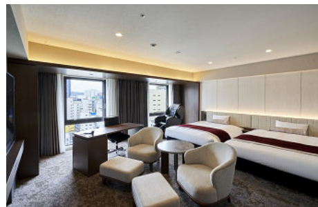
【客室 ジュニアスイート】