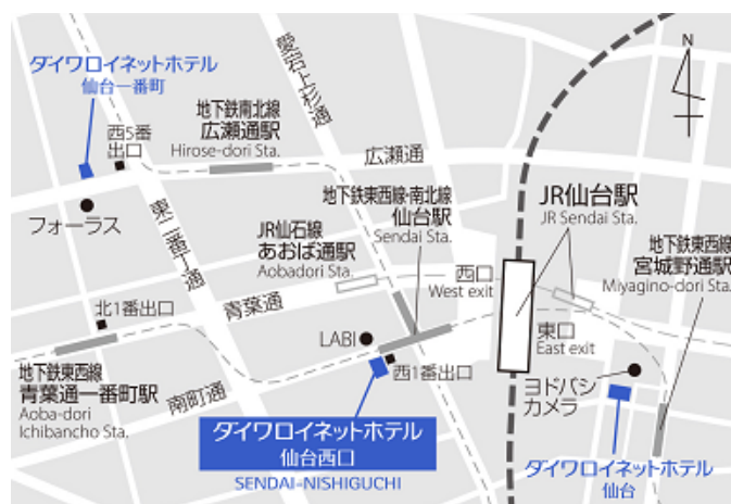
【「ダイワロイネットホテル仙台西口」地図】