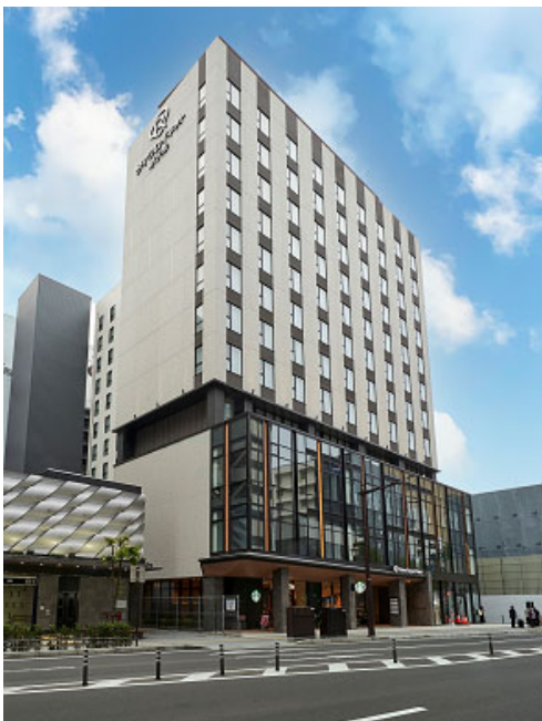
【「ダイワロイネットホテル仙台西口」外観】