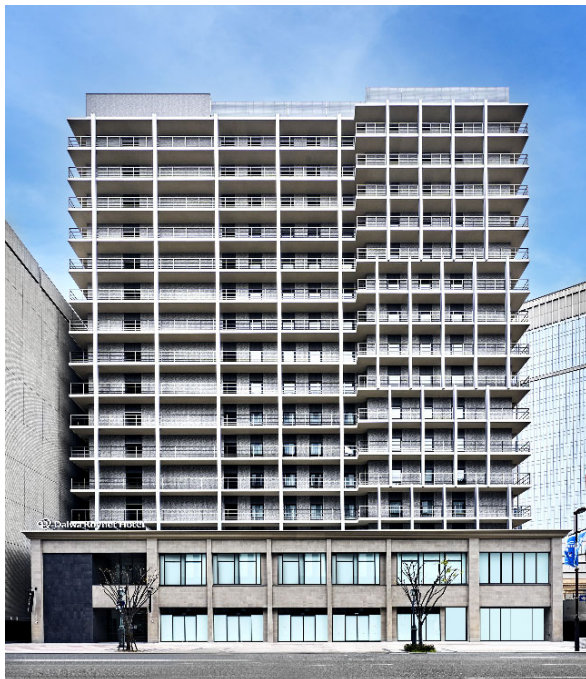
【 外観 】