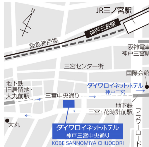
【「ダイワロイネットホテル神戸三宮中央通り」地図】