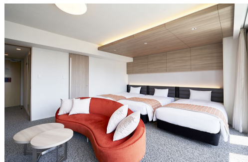
【 客室 ジュニアスイート（トリプル） 】