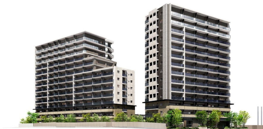
【「ブライトクロス博多」外観イメージ】

※1. 2021年10月1日から2022年3月31日までの成約戸数。九州（福岡県、佐賀県、長崎県、熊本県、大分県、宮崎県、鹿児島県）で分譲された新築マンションの中で最多。株式会社九州産業研究所調べ。