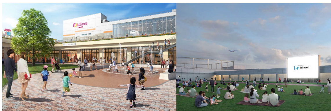
「三井ショッピングパーク ららぽーと福岡」イメージ

周辺には、大和ハウス工業が運営する「フォレオ博多」(SOUTH、EAST とも徒歩 16 分)や、「福岡市立那珂小学校」(SOUTH 徒歩 6 分/EAST 徒歩 7 分)、「博多那珂郵便局」(SOUTH 徒歩 9 分/EAST 徒歩 6 分) などもあり、商業施設が充実しているだけでなく、教育施設や医療機関、金融機関など、生活に必要な施設がそろっています。