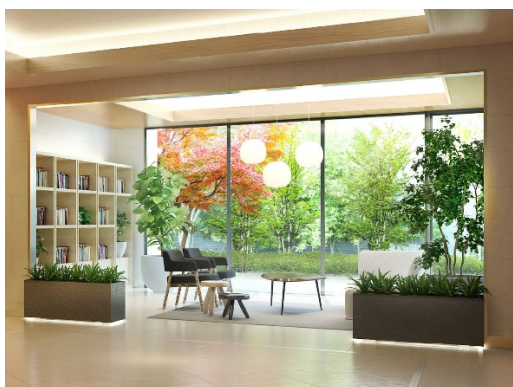
ライブラリーラウンジ (SOUTH)

*4.「ライブラリーラウンジ」、「スタディールーム」、「ランドリールーム」、「多目的洗場」は、「SOUTH」、「EAST」の両棟にそれぞれ用意しています。