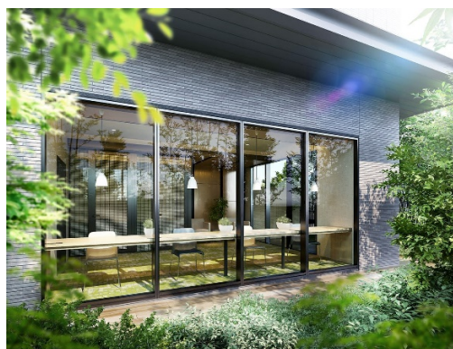
スタディールーム (EAST)

間取りは 1DK から 4LDK までの全 21 タイプを用意し、家族構成やライフスタイルにあったプランをお選びいただけます。