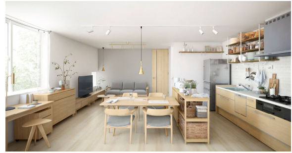
【「Lifegenic」平屋 内観イメージ】