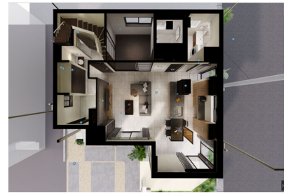
【「メタバース住宅展示場」イメージ】

当社は、2021年10月より戸建住宅におけるお客さまへのアプローチとして、Web上で「家づくりタイプ診断」を行った上でお客さまの嗜好や興味関心がある家づくり情報を届け、リレーションを図るWebサイト「LiveStyle PARTNER（リブスタイル パートナー）」 ※4 の運用を開始しました。