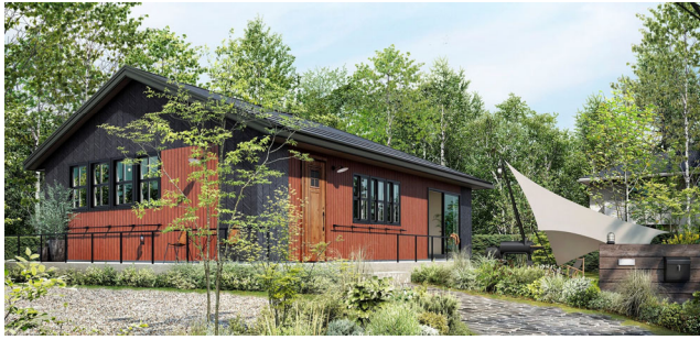
【「Lifegenic」平屋 外観イメージ】