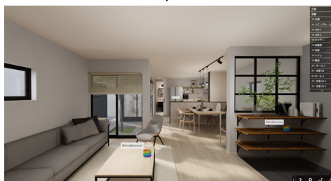
【床や天井のデザイン変更イメージ】