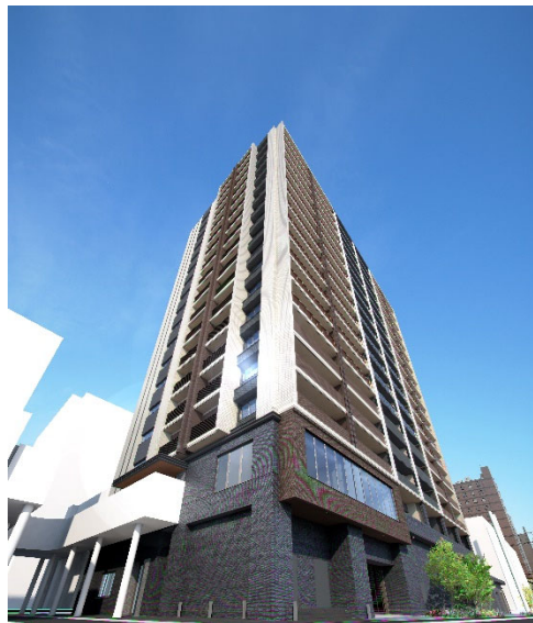
【プレミスト徳山ザ・レジデンス】

周南市・徳山にふさわしい“ライフスタイルセンター”の創出を目指して開発が進められている、駅前ビルや商業施設、ホテルなどの複合再開発「徳山駅前地区第一種市街地再開発事業」内において、当社は分譲マンション「プレミスト徳山ザ・レジデンス」を販売します。