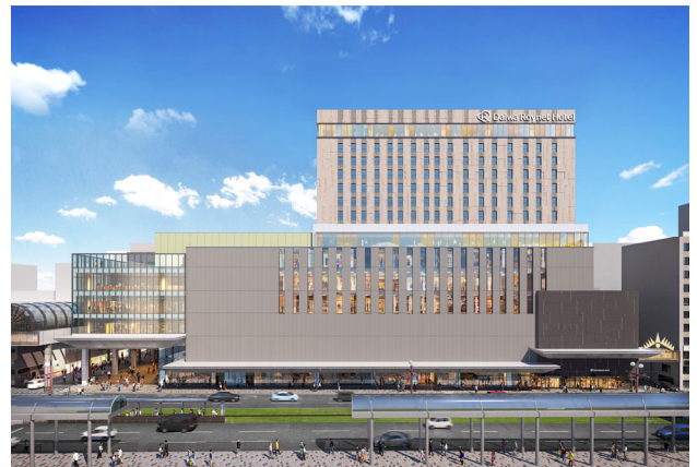
【ダイワロイネットホテル鹿児島天文館】