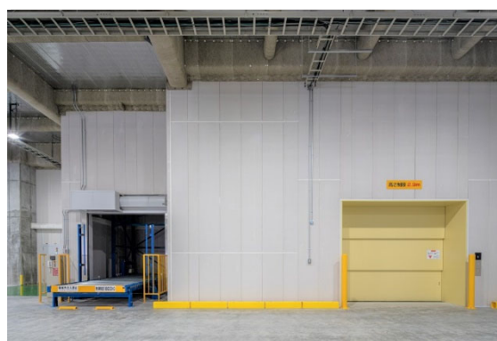
貨物用エレベーター