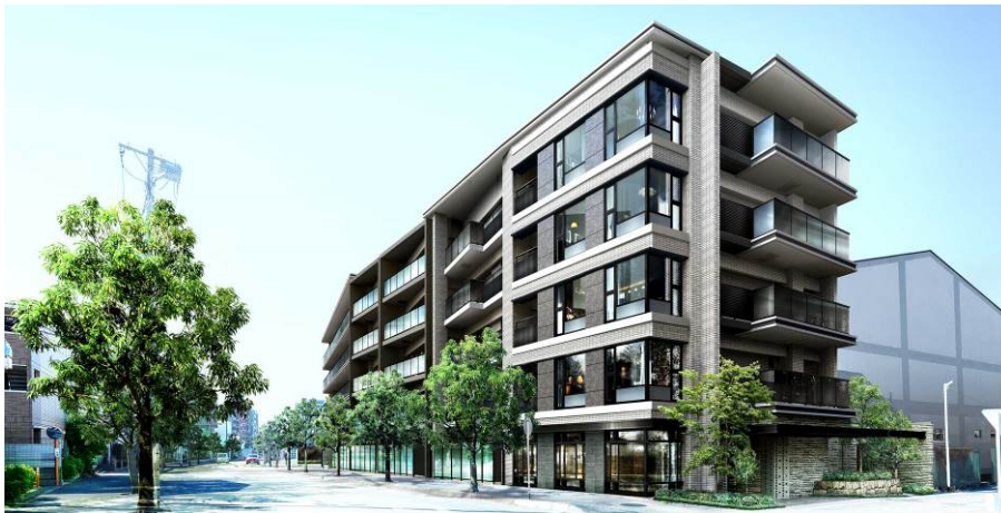
【「プレミスト和光丸山台」外観パース】

大和ハウス工業株式会社（本社：大阪市、社長：芳井 敬一）は、埼玉県和光市において、分譲マンション「プレミスト和光丸山台」（地上5階建て、総戸数36戸）を建設中ですが、2021年9月11日より販売を開始します。