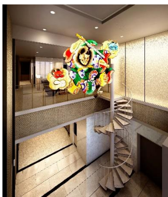
【エントランスホールイメージ】

あわせて、共用施設として 2 階にご入居者専用のラウンジを設け、ご入居者同士が寛げる空間も用意しました。