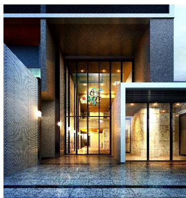
【南側エントランスイメージ】