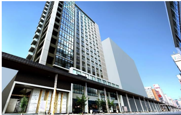
【「プレミスト青森新町ザ・タワー」外観イメージ】

「プレミスト青森新町ザ・タワー」は、青森市中心部の「青森ねぶた祭」運行ルートでもある「新町通り」沿いに位置し、ビジネスホテル「ドーミーイン」やオフィス、商業施設などが開発される官民一体複合再開発プロジェクト「中新町山手地区第一種市街地再開発事業」地内に誕生する分譲マンションです。