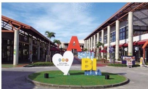
【沖縄アウトレットモールあしびなー】

今後は両社が持つ経営資源を最適に配分することで、事業シナジーの最大化を目指し、より効率的な企業経営を進めるとともに、より収益性の高い事業構造の構築を図ってまいります。