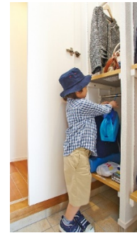
「自分専用カタツケロッカー」

また、散らかりがちなりビング・ダイニングにも「自分専用ボックス」を設け、雑誌や美容グッズ、勉強道具など、それぞれのモノを自分のボックスにしまえるようにしました。