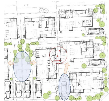
採光、通風シェアのイメージ

また、お互いのプライバシーにも配慮し、隣戸との窓の重なりや干渉を避けるよう建物配置も調整しました。