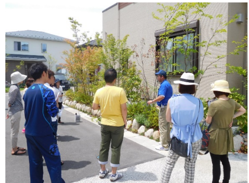
「お手入れ相談会」(イメージ)