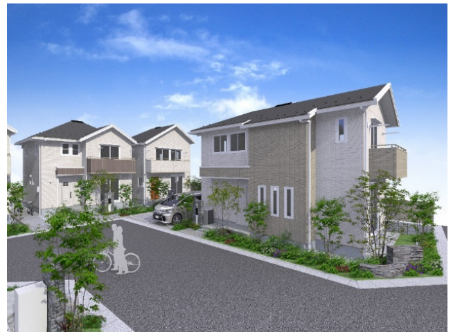
家事シェアタウン「セキュレア武蔵府中 ひかりテラス」街なみパース