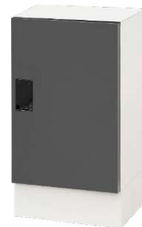
当社オリジナル宅配ボックス

あわせて、帰宅後に玄関からリビングを通らずに洗面室へ行くことができる「家事シェア動線」を間取りに採用し、外部からウイルスを持ち込みにくいよう配慮。加えて、洗面化粧台には非接触型の水栓を採用しました。