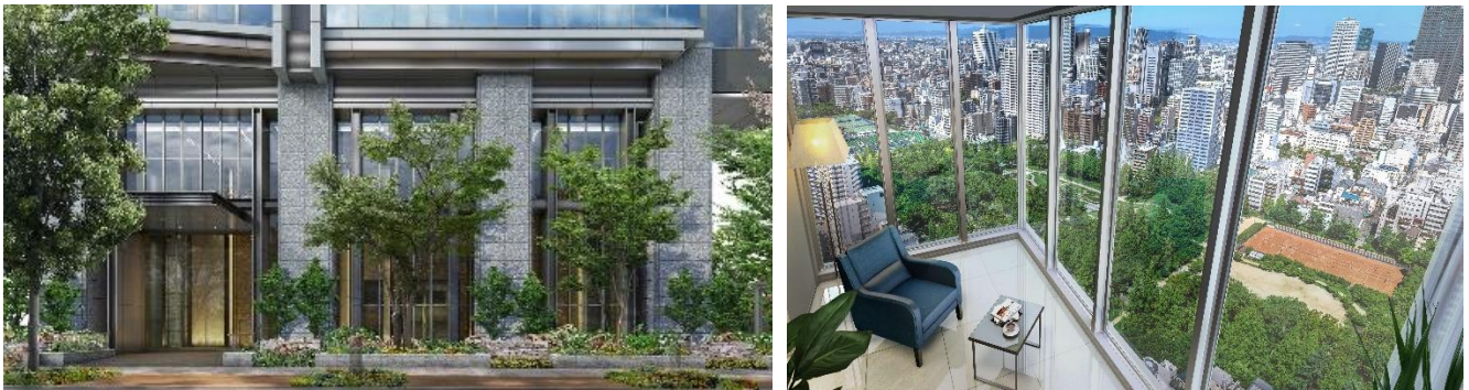
【プレミスタワー靱本町】

大和ハウス工業株式会社（本社：大阪府大阪市、社長：芳井敬一）は、大阪市西区において分譲マンション「プレミスタワー靱本町」を建設中ですが、その概要が決定しましたのでお知らせします。なお、本物件は2021年1月9日にモデルルームをオープンし、同年2月下旬より販売を開始します。