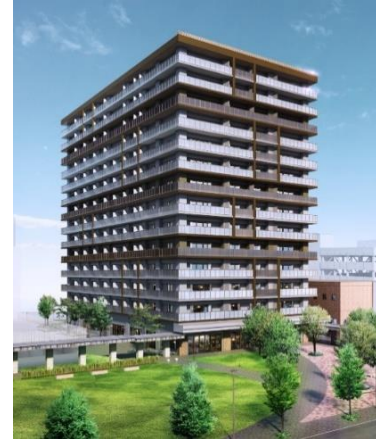
『イニシアグラン札幌イースト』 モデルルーム（左）・外観完成予想CG（右）