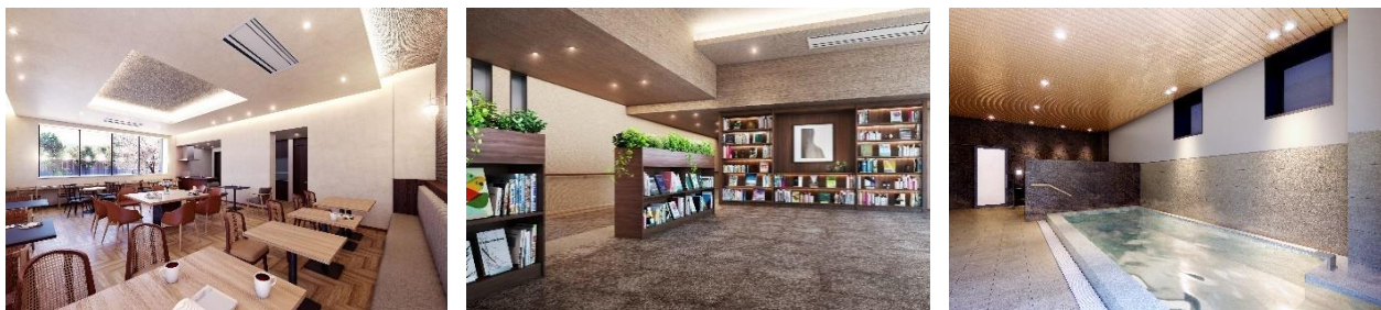
『イニシアグラン札幌イースト』 カフェダイニング (左) ・ ホワイエ (中) ・ 大浴場 (右)