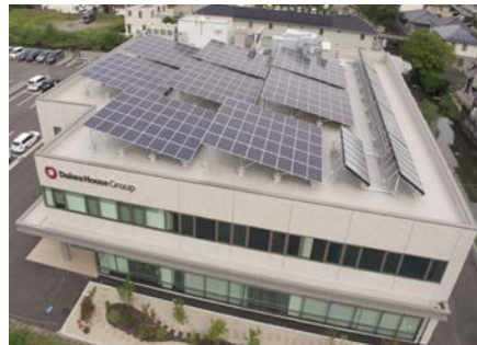
【ZEBを実現した大和ハウス佐賀ビル】

※5.非化石価値を非化石取引所で売買可能とするため証書化した非化石証書を付加することによって当社グループの発電所による電力の使用を証明