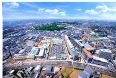
【船橋グランオアシス】

当社では、自社施設で培った省エネルギー化や再生可能エネルギー利用の技術を基に、まちづくりを展開しています。2019年7月には、「施工」から「暮らし」まで再生可能エネルギー由来の電気だけで100%賄うまちづくり「船橋グランオアシス」を開始しました。本プロジェクトでは、戸建住宅や分譲マンション、賃貸住宅の入居者に当社グループの再生可能エネルギー発電所由来の電気を供給するとともに、施工時の工事用電源にも同様の電気を利用しています。