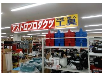
「当社初出店のアストロプロダクツ」

車やバイクを自分で整備することが好きなお客さまだけでなく、修理・点検などを行う職方向けに、約 50 坪の面積に約 3,500 アイテム ※1 の商品を取り揃えています。