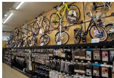
「オプションパーツも充実の品揃え」