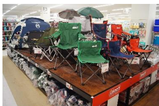
「流行のアウトドア商品」

あわせて、フィットネスチューブやヨガマットなど、自宅でできるフィットネス関連の商品も約400アイテム*1取り揃えています。