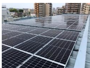
「太陽光発電システム」

※7.省エネルギーに役立てるために、建物のエネルギーや室内環境を把握するシステム。