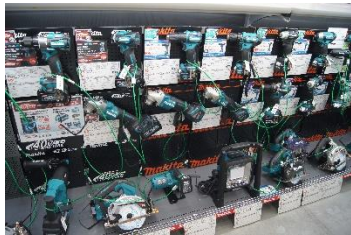
「幅広い品揃えの電動工具」

あわせて、車 19 台分の屋根付き積み込み場も完備しているため、雨天時にも安心してご利用できます。