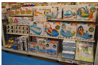
「暑い夏にお庭で使える小型プール」