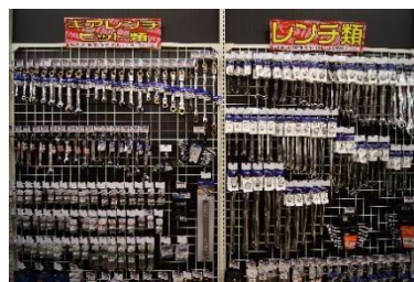
「豊富な専門工具類」