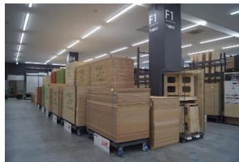
「品質にこだわった建築資材」