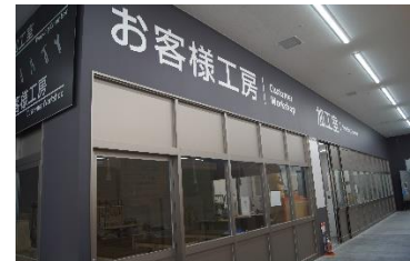
「購入品の加工ができるお客様工房」