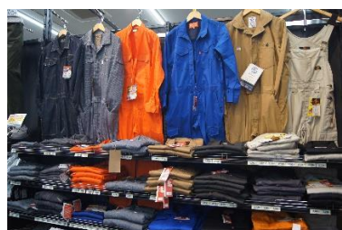
「多種多様なパリエーション」