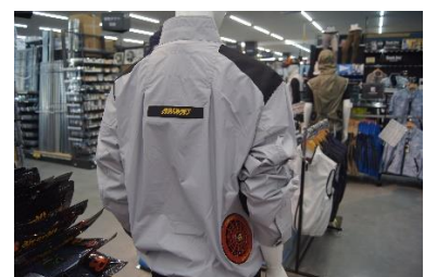
「熱中症対策になるファン付きウェア」