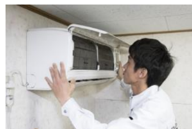
【取り付け・交換代行サービス】