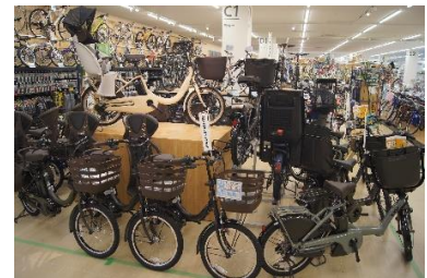
「街乗りで人気のミニベロ」