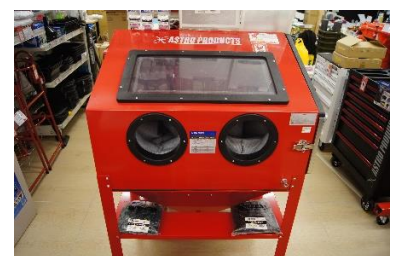
「サビ取りなどに使うサンドブラスト」