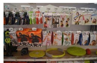
「健康促進のフィットネス商品」