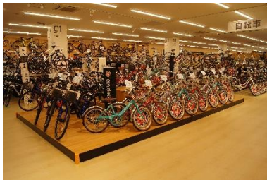
「当社最大の自転車売場」