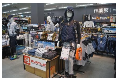
「機能性を追求した作業服」

※5.当社員カードをお持ちの方は、名入れ 1 箇所無料、裾上げは無料で利用可能です。裾上げは即日お渡し可能。（但し、数量と受け付け時間により翌日又は後日対応となる場合がございます。）