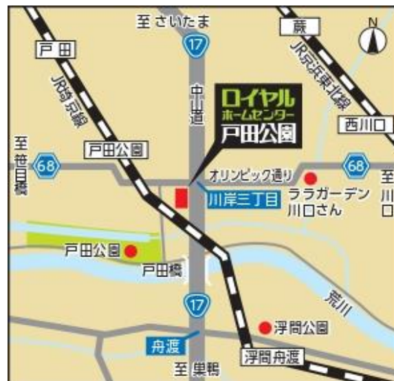
「ロイヤルホームセンター戸田公園」(案内図)