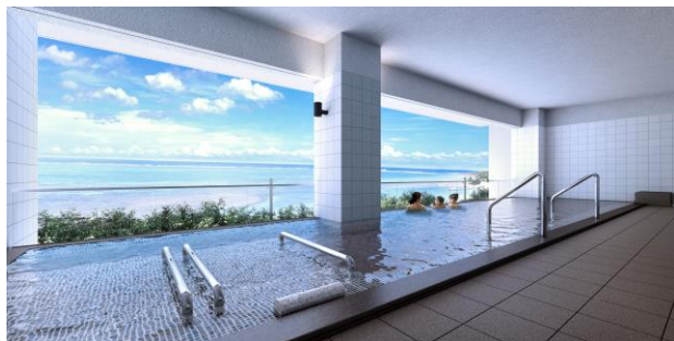
【展望風呂昼景イメージ図】

当館は、NPO「日本列島夕陽と朝日の郷づくり協会」の「日本の夕陽百選の宿」に選ばれたホテルです。東シナ海一面に広がるダイナミックな夕景を、展望風呂からお楽しみいただくことが可能です。