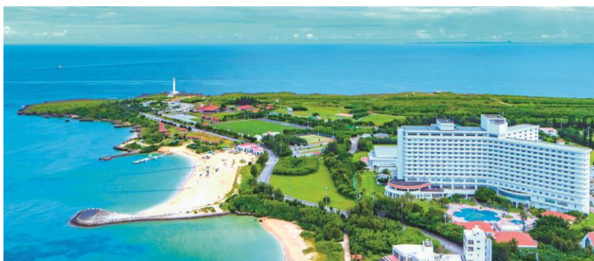
「Royal Hotel 沖縄残波岬」 全景

大和リゾート株式会社 「Royal Hotel 沖縄残波岬」 予約担当 電話：098-958-3838