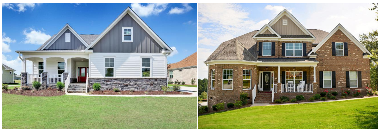
【エセックス社の戸建住宅商品(例)】

大和ハウスグループの Stanley-Martin Communities, LLC (以下、スタンレー・マーチン社) は、2020年2月12日(日本時間:2月13日)、米国で戸建住宅事業を行う Essex Homes Southeast, Inc. 及びその関係会社(以下、エセックス社)と事業譲渡契約を締結し、エセックス社のノースカロライナ州、サウスカロライナ州における事業を、2020年2月下旬に譲り受けることとなりました。