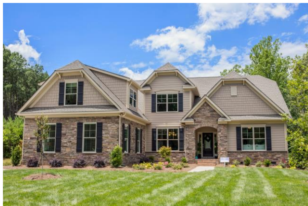
【エセックス社の戸建住宅】

広報企画室 広報グループ 06-6342-1381 東京広報グループ 03-5214-2112