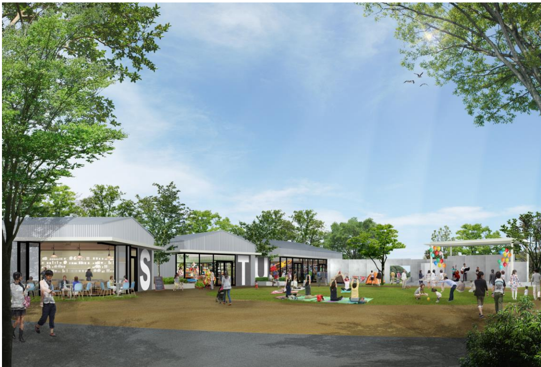
完成予想イメージ ※イメージであり実際とは異なる場合があります。

当施設は駅前の立地を生かし、生活・利便エリアに食品スーパー・ドラッグストア・フィットネス・医療モール、体験・滞在エリアに書店・飲食店・カフェ・専門店・保育園などさまざまな機能の店舗を配置。また、芝生広場などの緑豊かな空間を整備するなど、買い物だけでなく通いたくなる「場」を提供します。「ブランチ岡山北長瀬」は地域コミュニティを生み出し、子どもから高齢者まで多様な世代が共存共栄し合える魅力的な施設を目指します。