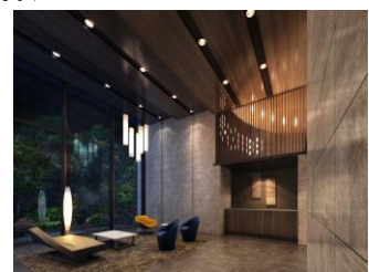
【エントランスイメージ】

当物件の外観デザインには、小山市の伝統工芸である「結城紬」の縞模様や格子模様をモチーフに、白とグレーのガラス手摺をアクセントにしました。エントランスには、小山市の「オモイガワザクラ」をイメージした照明や、壁上部のデザインに小山市の伝統行事の「流し雛」を表現するなど、小山市の文化を取り入れています。