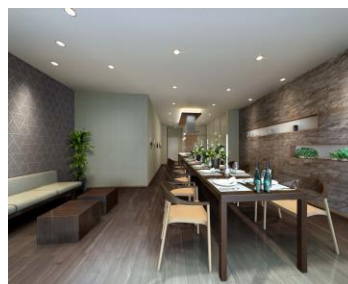
【パーティールーム】