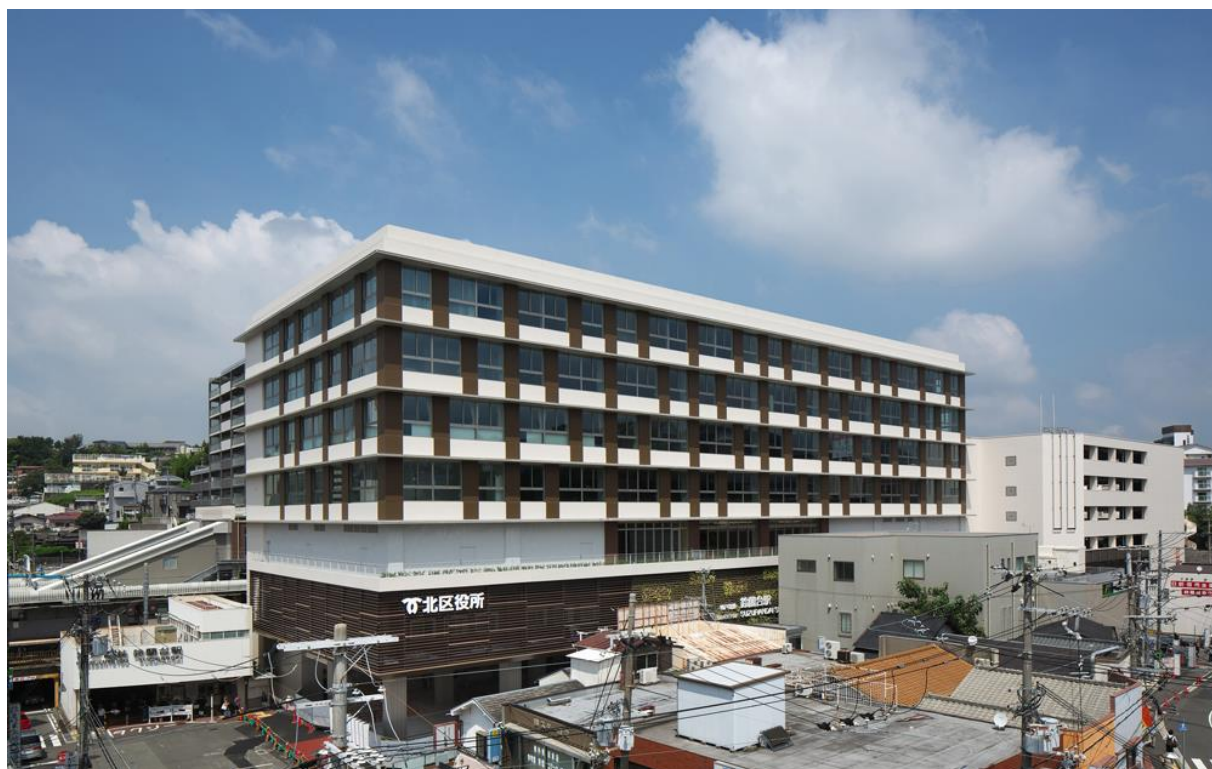
「鈴蘭台駅前再開発ビル」外観写真

当施設は神戸市北区の玄関口である鈴蘭台駅前の市街地再開発事業にともない整備を進めている7階建の再開発ビルで、4～7階には北区役所の新庁舎、1～3階には商業・業務施設が入居し、1階ピロティ部分にはバス乗り場などの交通広場を整備。3階部分では鈴蘭台駅の新駅舎と接続します。この再開発ビルは特定建築者である当社が設計・施工を行い、完成後は施設の管理者として携わっていきます。