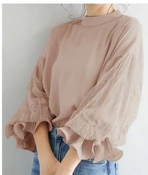
フリル袖ストライプブラウス(左)