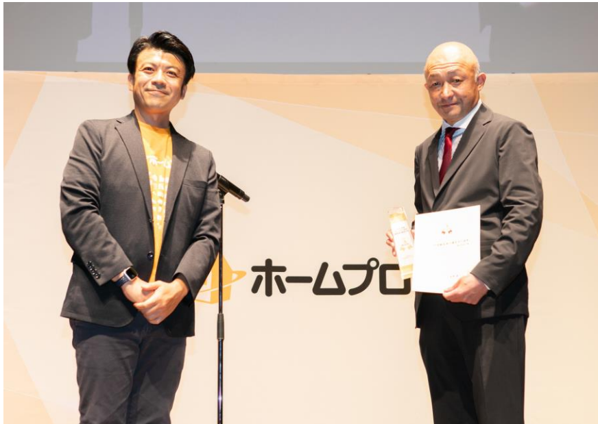
ホームプロ表彰 2021年度 表彰式の様子