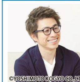
田村 淳さん (ロンドンブーツ1号2号)