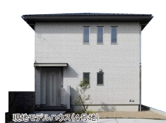
現地モデルハウス(4号地)