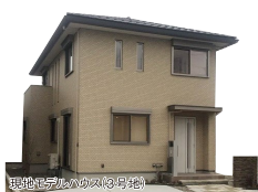
現地モデルハウス(3号地)