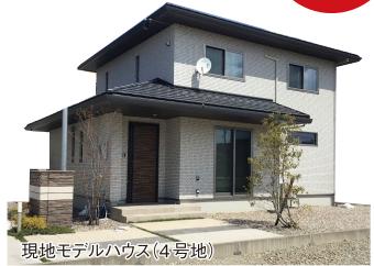
現地モデルハウス(4号地)