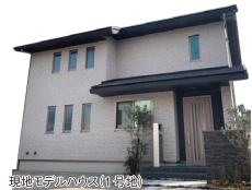
現地モデルハウス(1号地)