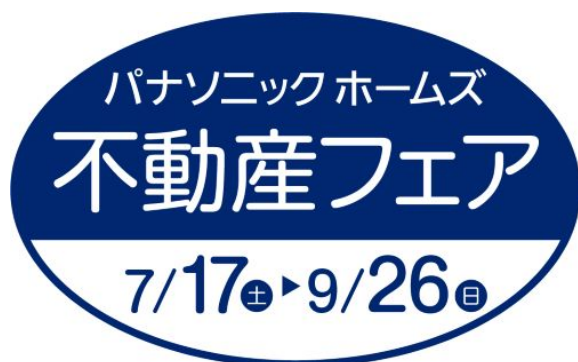
『パナソニック ホームズ不動産フェア』ロゴ

なお、期間中、分譲物件の現地にWEB予約の上ご来場いただいた方には、「災害に備える」住まいの知恵と工夫を紹介した「安心 BOOK」と、普段は夜間のウォーキングやアウトドアに、万一のときは非常用・防災用ライトとして使える「パナソニック LED ネックライト」をセットにした、「防災に役立つ「安心 BOX」をプレゼントします。(数に限りがありますので、無くなり次第終了します)