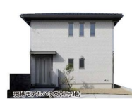
現地モデルハウス(4号地)