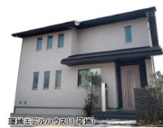
現地モデルハウス(1号地)