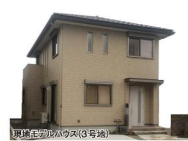
現地モデルハウス(3号地)