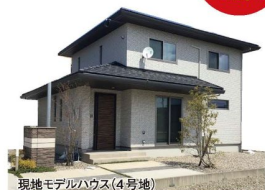
現地モデルハウス(4号地)