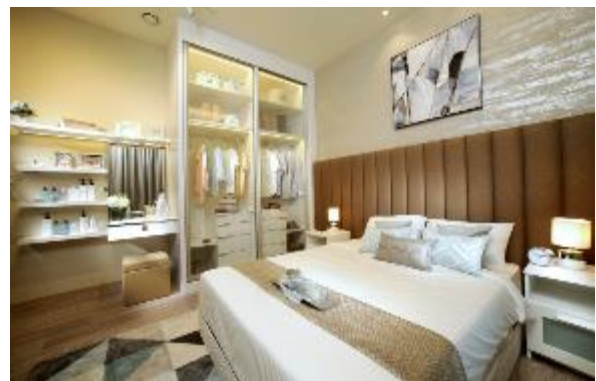
3LDK タイプ・主寝室(モデルルーム)