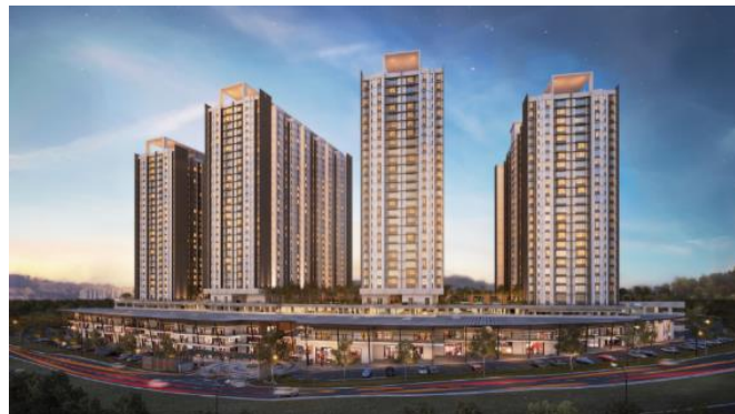
『MIRAI Residences(未来)』イメージパース

『MIRAI(未来)』はクアラルンプールから南東20km地点のカジャン地区中心部に位置し、2021年4月に開業予定の現地鉄道・新カジャンKTM駅から徒歩7分の恵まれた立地条件にあります。また、大規模マンションのスケールメリットを生かし、約14,770㎡の共用部に40以上の共用施設・設備を充実。さらに、全住戸にはパナソニックがアジアで展開する、空気質“Quality Air For Life (QAFL)※1”技術を採用します。全熱交換気システム(住戸タイプによっては換気システム)※2とnanoe™ X※3付エアコン(2台)を各住戸に設置し、室内空気を清浄に保ちます。機械換気によって窓を開けずに自動で換気を行い、室内空気を入れ替えることで、コロナ禍で高まる室内の空気質に対する人々のニーズを満たし、安心して快適な暮らしをお届けします。