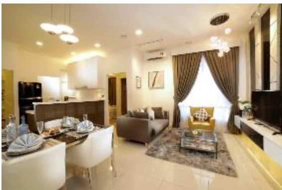
3LDK タイプ・リビングルーム(モデルルーム)

各住戸は、2LDK や 3LDK など、3 タイプを取り揃え、カップルから子育て家族まで、幅広い層に暮らしやすい空間を用意しました。