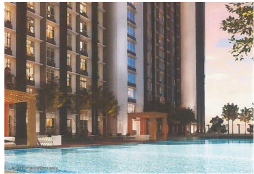
50m プール イメージパース