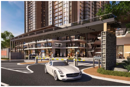
エントランス イメージパース