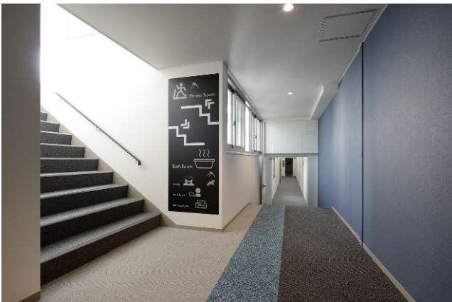
1・2号棟 ロケーションを示すピクトサイン