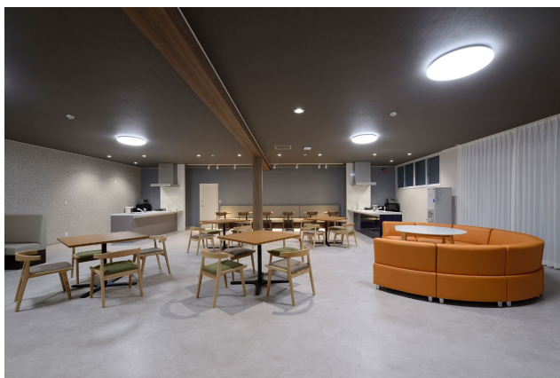
共用棟 メインリビング

玄関から寮室へ向かう廊下側にメインリビング内部を見渡せる室内窓を設け、開放的な空間にしました。リビング奥にはゆるやかにゾーン分けしたキッチンスペース、ダイニング・リラククスコーナーなどを設け、「くつろぐ」、「食べる」、「遊ぶ」、「話す」といった思い思いの過ごし方が可能なカフェのような空間づくりにより、プライベートタイムでの交流も促す工夫を施しています。