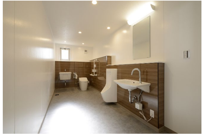
共用棟 バリアフリートイレ