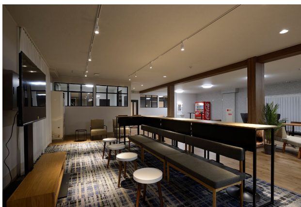
共用棟 メインリビング設置のハイカウンター

●本件に関するお問合せ先 パナソニック ホームズ株式会社 宣伝・広報部 広報課 担当：井筒・古矢・潤隨(かんずい) / TEL:06-6834-1955