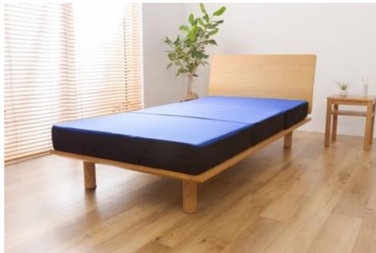
スリープマジック 極厚マットレス 14.0 シングルサイズ ¥49,900（税別）