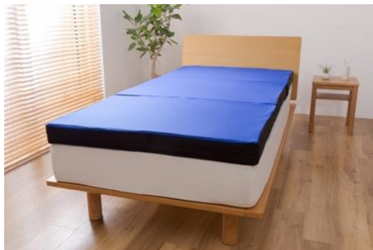
スリープマジック マットレス 9.0 シングルサイズ ¥39,900（税別）

8月26日(水)～9月30日(水) 23:59まで ライズ公式サイトにてデビューキャンペーンを開催 URL： https://www.risetokyo.jp/f/campaign/sleepmagic-debut