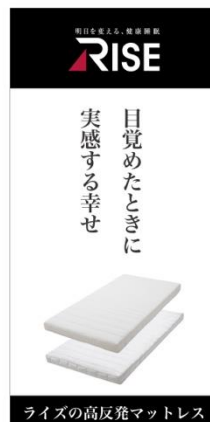
ライズの高反発マットレス