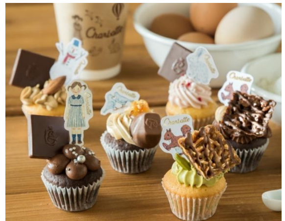
『CharLotte X KIRIKO LOUNGE』提供メニュー

『バレンタインマルシェ Produced by HINKA RINKA』は、東急プラザ銀座3階～5階に位置する、東急百貨店が発信する大人のセレクトストア「HINKA RINKA」がプロデュースをするバレンタインシーズン限定のマルシェです。NY発のチョコレート専門店「カカオ マーケット バイ マリベル」をはじめとした、国内外から厳選された5店舗が出店します。