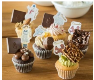
画像はイメージです