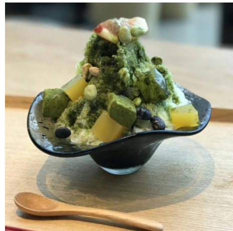
<オリジナルかき氷>

「THE GREEN Cafe American Express × 数寄屋橋茶房」は、東急プラザ銀座6階KIRIKO LOUNGE内のカフェラウンジ「数寄屋橋茶房」とアメリカン・エクスプレスのコラボレーションにより実現し、8月25日(金)～9月22日(金)の期間限定でオープンするカフェです。