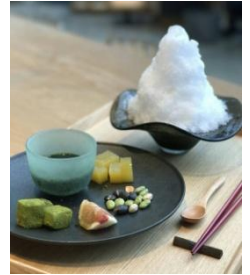
オリジナルかき氷