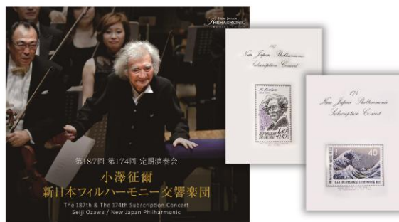
【非売品】特製CDと公演プログラム（レプリカ） ※イメージ