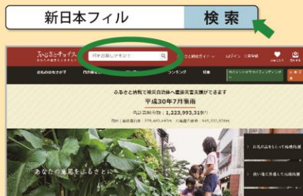
※ウェブサイトトップ画面イメージ