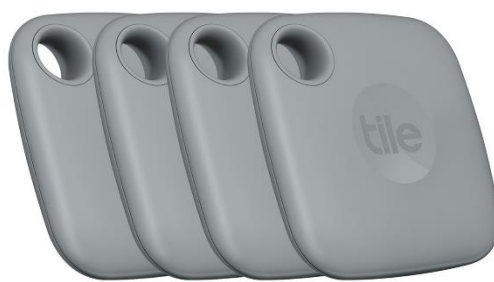
Mate (2022) 4個パック