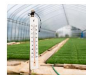
ビニールハウス管理