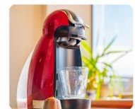
コーヒーメーカー