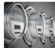
スマートメーター