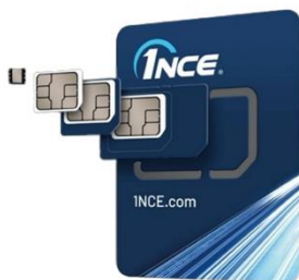
1NCE IoT フラットレート