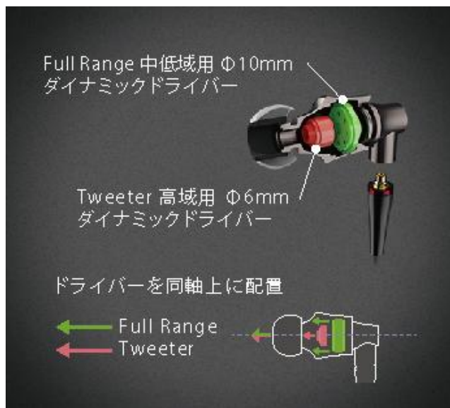
Phase Matching Coaxial Driver