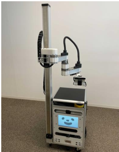
フューチャーコンビニエンスストアチャレンジ出場ロボット

ソフトバンクにおける自走ロボットに関する取り組みをご紹介します。また、「WRC」の“フューチャーコンビニエンスストアチャレンジ” ( https://wrs.nedo.go.jp/wrs2020/challenge/service/fcsc.html ) に出場します。なお、NEDOのブースでは、ソフトバンクと佐川急便株式会社が「自動走行ロボットを活用した新たな配送サービス実現に向けた技術開発事業」で実証実験を行ったロボットをご紹介します。