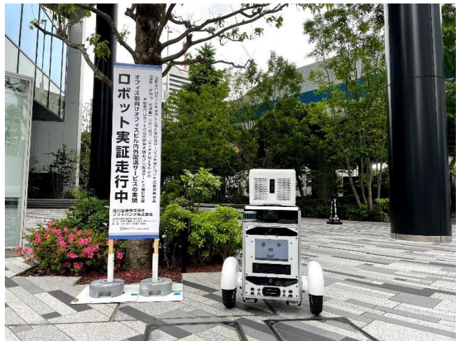
NEDOブース展示ロボット