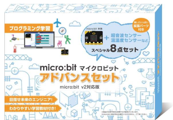
STEAM教材/micro:bit アドバンスセット