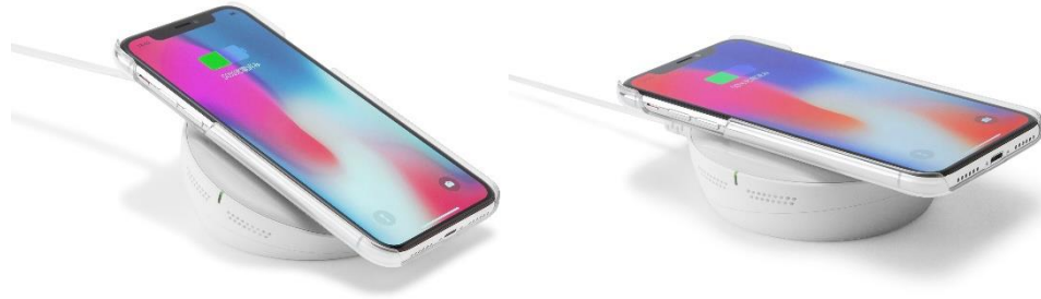
スタンドでの利用時