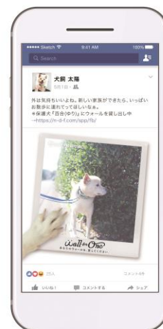
※アカウントを貸し出している投稿イメージ

本キャンペーンでは、Facebook アカウントを持ってない保護犬・保護猫たちのために、Facebook ユーザー自身のウォールを貸し出してもらいます。その貸し出されたウォールに保護犬・保護猫たちが日常の様子や感じたことを画像と共に 1 週間、1 日約 3 回の計 22 回投稿していきます。これにより、ひとりでも多くの人に保護犬・保護猫たちの存在と日々の生活を知ってもらい、新しい家族が見つかるきっかけづくりとなることを目指します。