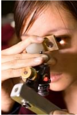
熟練工による高度なカット・研磨技術

グランバーガーダイヤモンド社は、最も輝きの美しい理想的なカットと呼ばれるエクセレントカットをも超える独自の高精度なカット技術「グランバーガー・プレジジョンカット®」を開発。