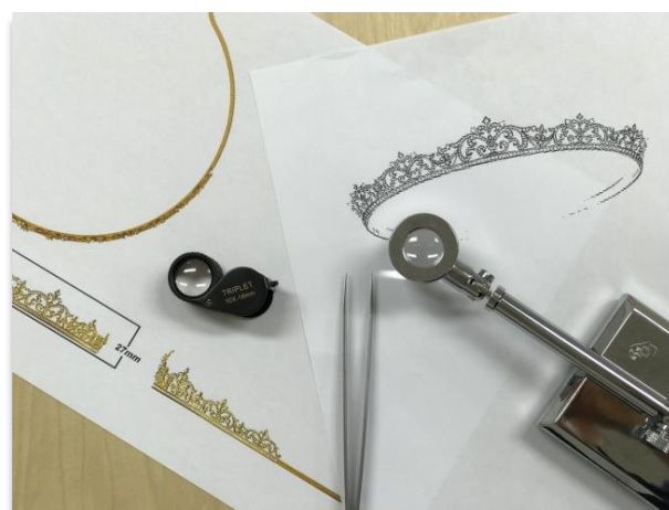
グランバーガー社特製ティアラデザインプラン

グランバーガー社製ダイヤを贅沢に1000ピース散りばめた気品溢れるゴージャスな特製ティアラ（販売価格400万円 税別）も初公開します！