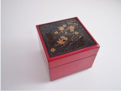
金沢の漆金蒔絵にグランバーガーメレダイヤを 散りばめたベルギー王室献上品の宝石箱