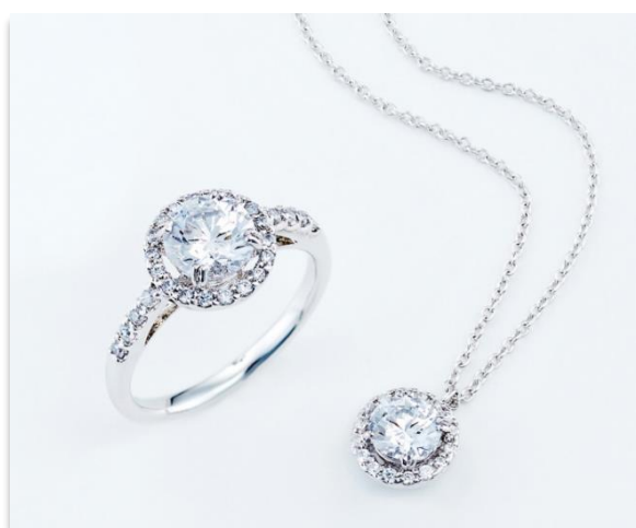
「stoRé ストリー」ブライダルジュエリー(例)

グランバーガー製の最高品質メレダイヤモンドとともにオートクチュールのような華やぎを添えたフルオーダーでワンランク上の新たなリフォームをテーマに期間限定でイベントを開催します。