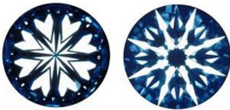
「ハート&キューピッド」

プレジジョン（精密）という名の通り、グランバーガーダイヤモンド社のダイヤモンドは腕を磨いた熟練工たちが丁寧に1石ずつ厳密に測定されたカットを施し、精巧に研磨することによりダイヤモンドの最高のブリリアンス（光輝）とファイア（煌き）を引き出し、ダイヤモンドをより洗練されたパーフェクトな形に導いています。70年間以上に及ぶ熟練したクラフトマンシップにより、「グランバーガー・プレジジョンカット®」は世界のハイジュエリーに時代を超越した美しい輝きを与えているのです。