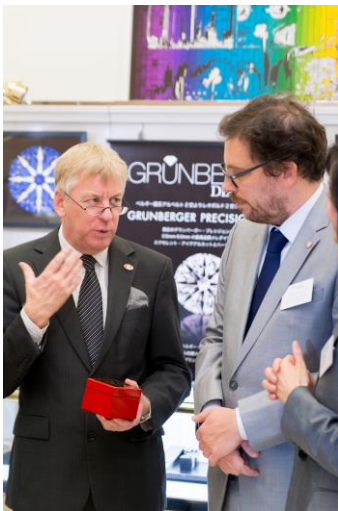
(左より) 献上品の宝石箱を持つギュンテル・ スレーワーゲン駐日ベルギー王国大使、「グラン バーガーダイヤモンドジャパン株式会社」サイ モン・グランバーガー社長 (於ベルギー王国大使館)