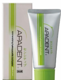
知覚過敏ケアタイプ 60g