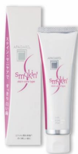
ステインケアタイプ ステイン・ヤニ除去成分(※1) ダブル配合 100g