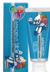
キシリトール配合 60g