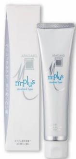
スタンダードタイプ ベーシックな処方です基本ケア 125g