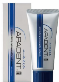
トータルケアタイプ 60g