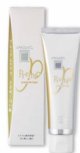
プレミアムタイプ 薬用ハイドロキシアパタイト 高配合(※2) 100g