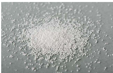
①スキンケア用アパタイトを粒状に