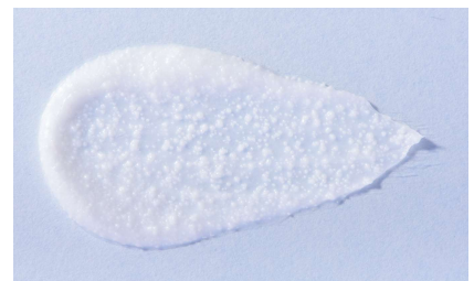
③超つぶつぶのテクスチャ