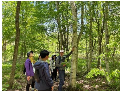
北エリア散策の様子