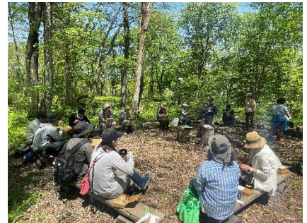
ピクニックの様子