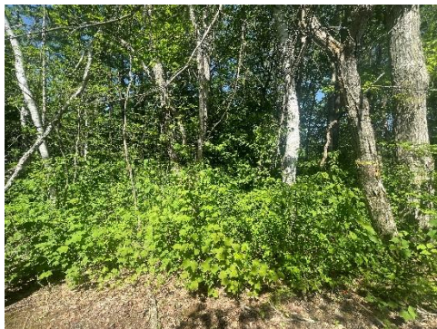
作業前の森の様子