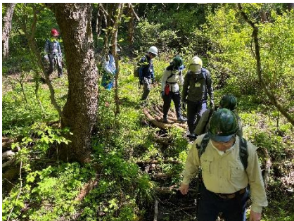
南エリアを歩く様子

ガイドの指示の元、決められた範囲内の指定の植物を社員自らの手で伐採する作業に従事し、汗を流しました。森にみるみる光が入り、作業前との明らかな違いを目の当たりにした社員は、午前中の講義の内容を身をもって理解し感嘆の声をあげました。終了後、社員からは「時間が短すぎる。もっとやりたかった。」という声が多くあがるなど、有意義で気持ちの良い時間を過ごしました。