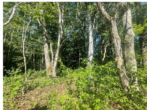
作業後の森の様子