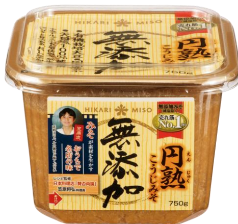
<正面デザインラベル拡大>

ひかり味噌株式会社(長野県諏訪郡下諏訪町、代表取締役社長 林 善博、以下当社)は、主力商品である『無添加 円熟こうじみそ』(750g 入のみ)の正面デザインラベルに、予約の取れない名店「賛否両論」笠原将弘料理長考案のレシピを付けた限定パッケージ商品を、5月上旬から全国のスーパーマーケットなどで発売いたします。