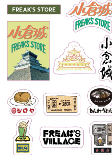
オリジナルのステッカーセット